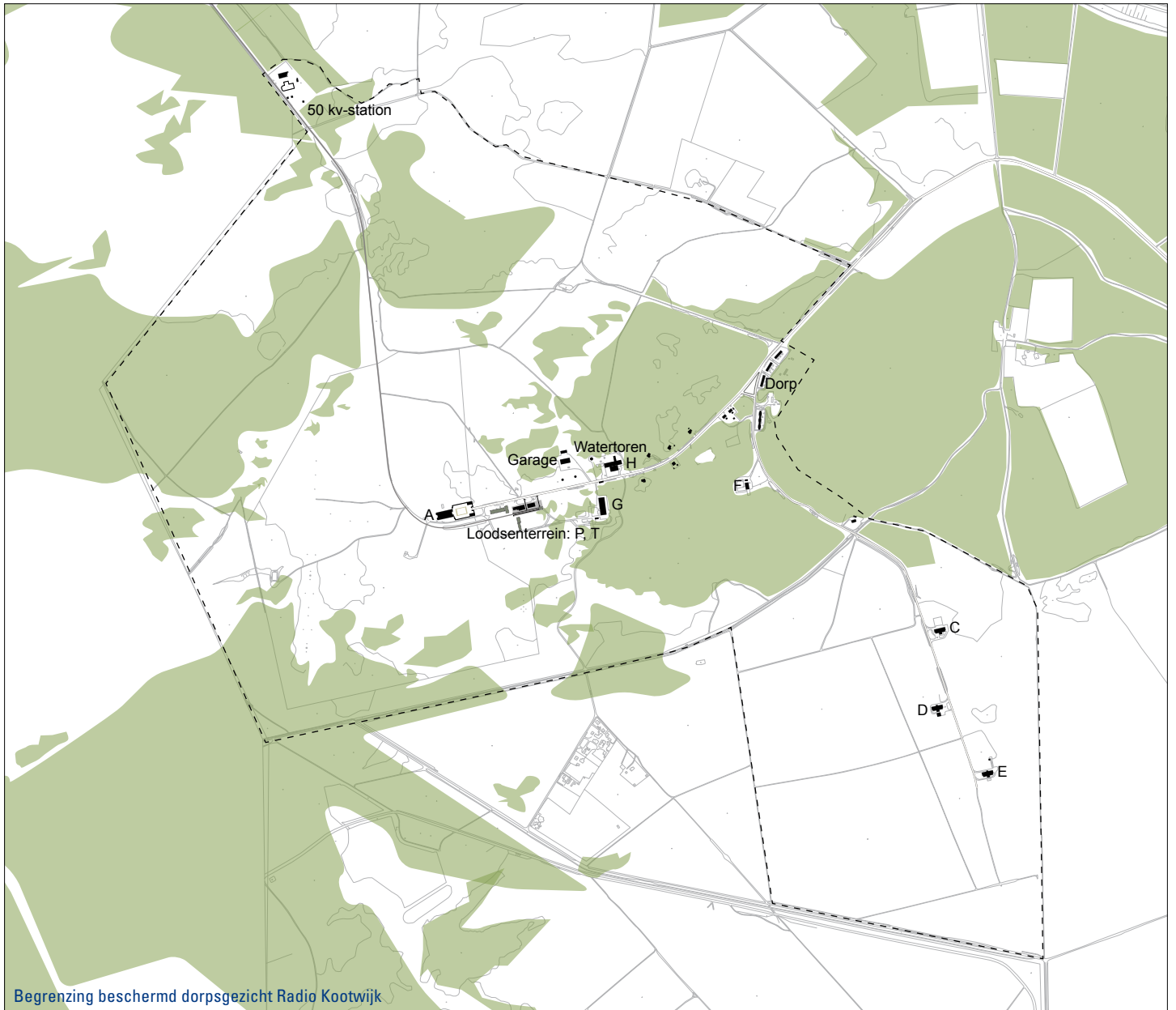
Begrenzing beschermd dorpsgezicht Radio Kootwijk