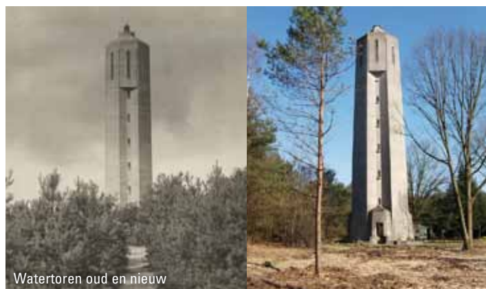
Watertoren oud en nieuw

Radio Kootwijk is een plek van verbinden, beleven van cultuur en natuur, van heden, verleden en toekomst. Het is een intrigerende omgeving die tot nieuwe ideeën inspireert. Gebouwen, stuifduinen en hei versterken elkaar. Het is ruimte die je raakt. Die combinatie maakt Radio Kootwijk tot een bijzondere plek; een plek die bewaard blijft voor generaties na ons op een manier die ook economisch verantwoord is. Daarmee is de herontwikkeling een invulling van de modernisering van de monumentenzorg: niet restaureren voor leegstand, maar voor economisch en cultuurhistorisch verantwoord hergebruik. De plannen worden door Staatsbosbeheer ingevuld in nauwe samenwerking met de gemeente Apeldoorn, de provincie Gelderland en de Rijksdienst voor het Cultureel Erfgoed. Die samenwerking heeft onder meer geresulteerd in een gezamenlijk financieel draagvlak en ook in het gezamenlijk opstellen van een nieuw, en inmiddels vastgesteld bestemmings- en beeldkwaliteitsplan. In deze plannen zijn de cultuurhistorische, architectonische en natuurwaarden niet alleen individueel maar ook in hun onderlinge samenhang beschouwd.