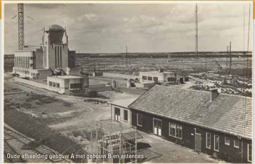
Oude afbeelding gebouw A met gebouw B en antennes

Het radiozendstation is in mei 1923 officieel in bedrijf gesteld, aanvankelijk voor morse telegrafieverkeer. De ontwikkelingen in de radiotechniek gingen snel. Na een paar jaar bleek dat de lange