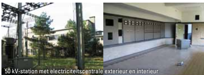
50 kV-station met electriciteitscentrale exterieur en interieur

Ook de werkplaats, gebouw G, met trafohuis stamt uit deze tijdperiode.