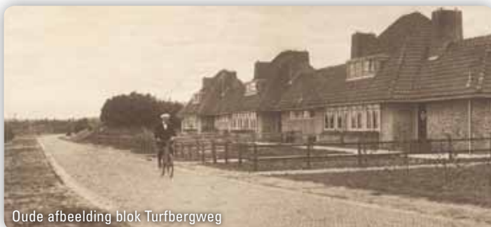
Oude afbeelding blok Turfbergweg

De garage aan de voet van de watertoren is tijdens de Tweede Wereldoorlog in opdracht van de Duitse bezetter gebouwd. Het gebouw diende voor de stalling en onderhoud van motorvoertuigen.