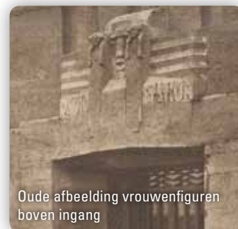
Oude afbeelding vrouwenfiguren boven ingang

samengewerkt met andere kunstenaars ter decoratie van de gebouwen. Boven de toegangsdeuren is een reliëf te zien, voorstellende een masker met geopende mond waarvan geluidsgolven uitgaan, geflankeerd door twee luisterende vrouwenfiguren, een Europese en een Oosterse, symboliserend de verbinding tussen Oost en West. Aan de achterzijde prijkt een groot rondboogvormig venster met erboven een adelaar. De adelaar symboliseert de vrijheid van de radiogolven in de lucht, de vlucht van het geluid. Beide reliëfs zijn een ontwerp van Hendrik van den Eijnde, beeldhouwer, meubelontwerper, graficus en tekenaar.