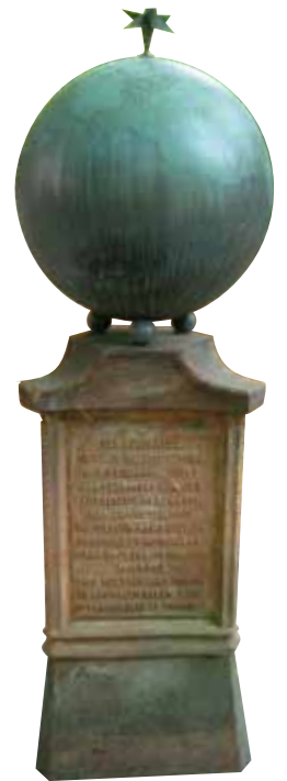
De wereldbol is geschenken door het personeel van het zendstation bij het 10-jarig bestaan.

In een zwerfkei is een gezicht zichtbaar gemaakt door beeldhouwer Titus Leeser, als symbool dat de stem van Radio Kootwijk over de hele wereld heeft geklonken, met daaronder de tekst: Hallo Bandoeng! 1928 28.2 1938. Het is de datum dat Koningin Emma de eerste telefoonverbinding met Nederlandse-Indië tot stand bracht met de legendarische woorden "Hallo Bandoeng. Hallo Bandoeng. Hoort u mij?".