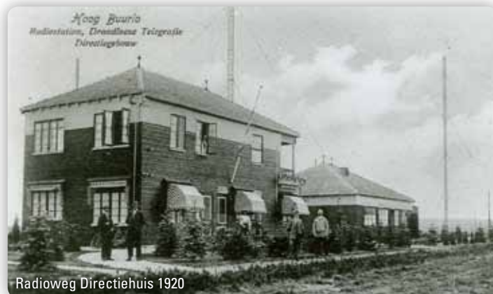
Radioweg Directiehuys 1920

In 1920 werd begonnen met een stenen directiegebouw met bovenwoning, ook wel het ingenieursgebouw of gebouw F genoemd, dat de keet in het barakkendorp moest vervangen. Een jaar later volgde het Tehuis voor Vrijgezelle ambtenaren, later Hotel Radio Kootwijk, in Amsterdamse School- en chaletstijl (hout gecombineerd met baksteen). Voor de korte golfzenders kwamen de gebouwen B, C, D en E tot stand,